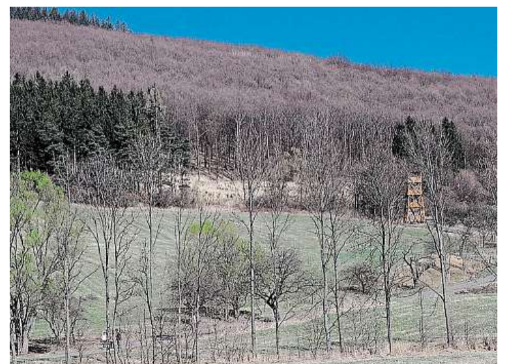
Rozhledny bez výhledu Všechny rozhledny vypadají stejně, vlevo Bánov a rozhledna Králův. Vpravo nahoře Nivnice a směrovky k ostatním rozhlednám. Na spodním snímku stavba v Bystřici pod Lopeníkem, která se nachází na úpatí kopce.

na nejvyšším bodě v katastru, místní obyvatelé si k ní dělají výlet před koncem roku a také je součástí červené turistické Stezky hrdinů Slovenského národního povstání.